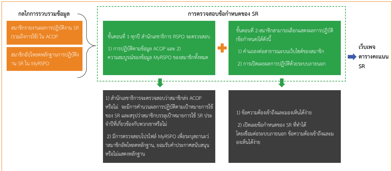
รูปที่ 2 กระบวนการตรวจสอบสองขั้นตอน

สืบเนื่องด้วยธรรมชาติของข้อกำหนด SR จึงมีการดำเนินการกระบวนการตรวจสอบสองขั้นตอน เพื่อให้แน่ใจว่าสามารถนำข้อกำหนด SR ไปใช้ได้สำเร็จ ดังแสดงในรูปที่ 2