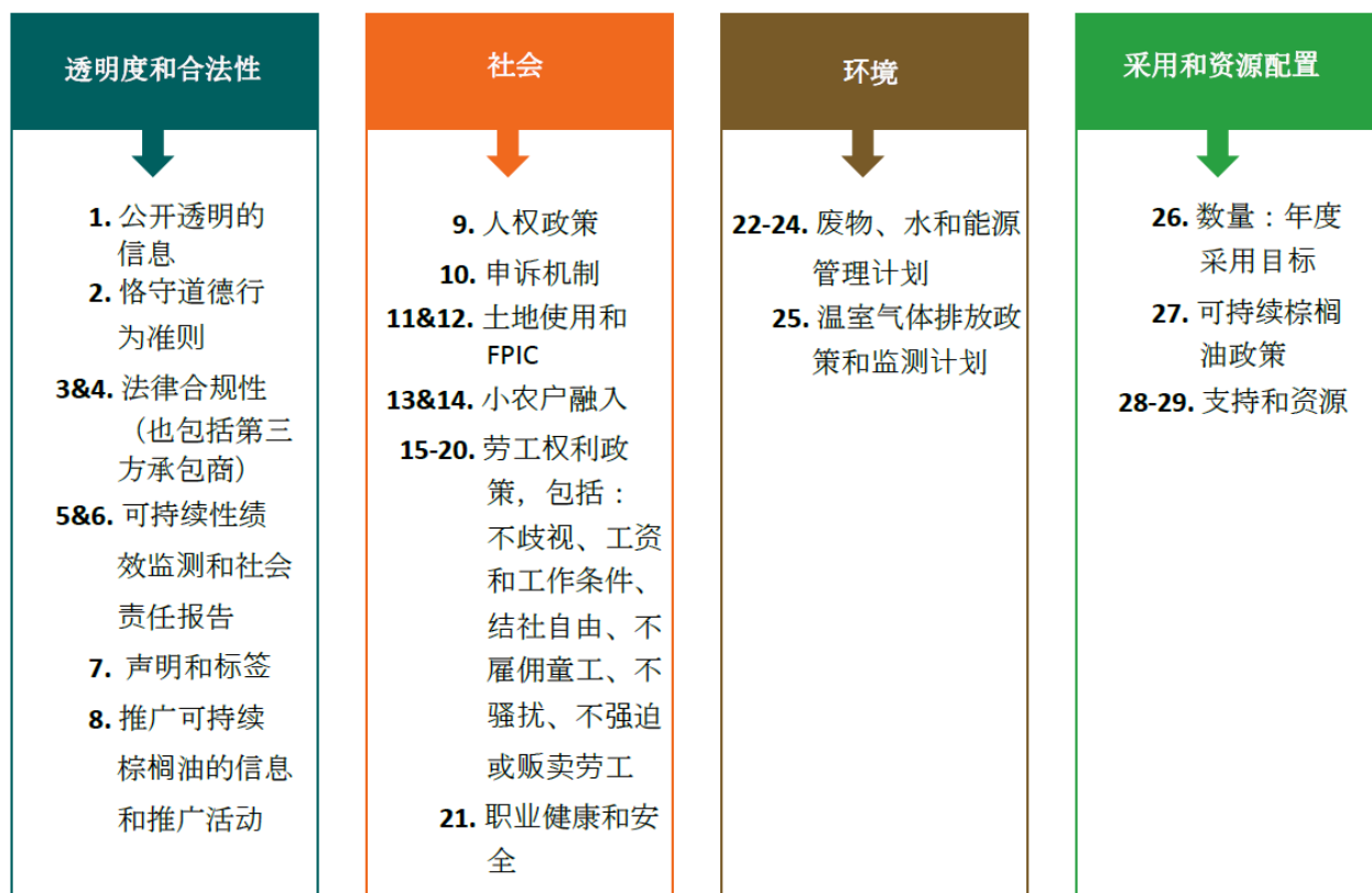
图1. 共同责任要求概述

为了实施“ 共同责任要求和实施 ”文件中概述的 SRTF 建议，包括在此过程中提出的问题和挑战，BoG 成立了共同责任工作小组（SRWG）。