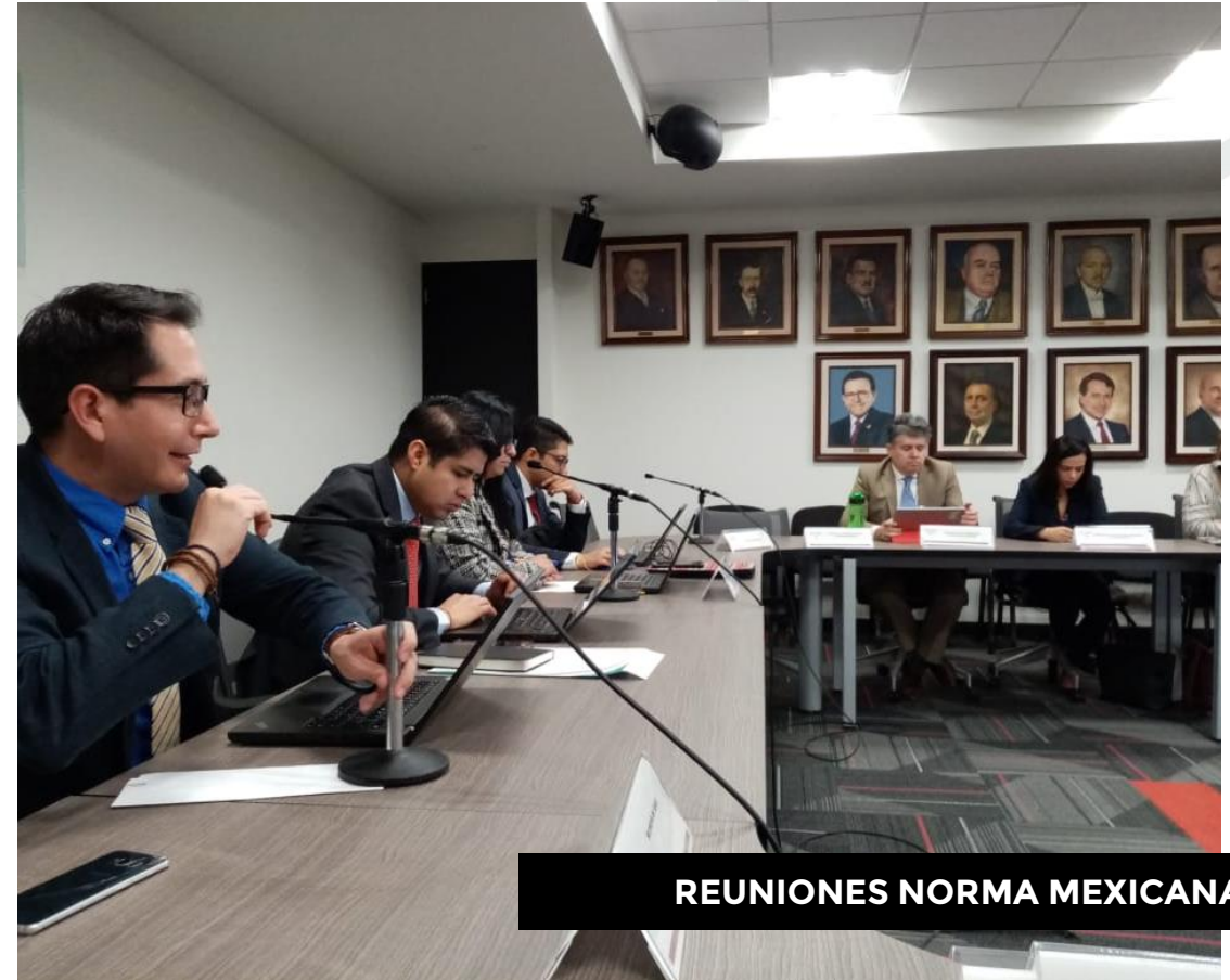
REUNIONES NORMA MEXICANA