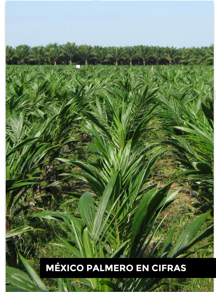
MÉXICO PALMERO EN CIFRAS