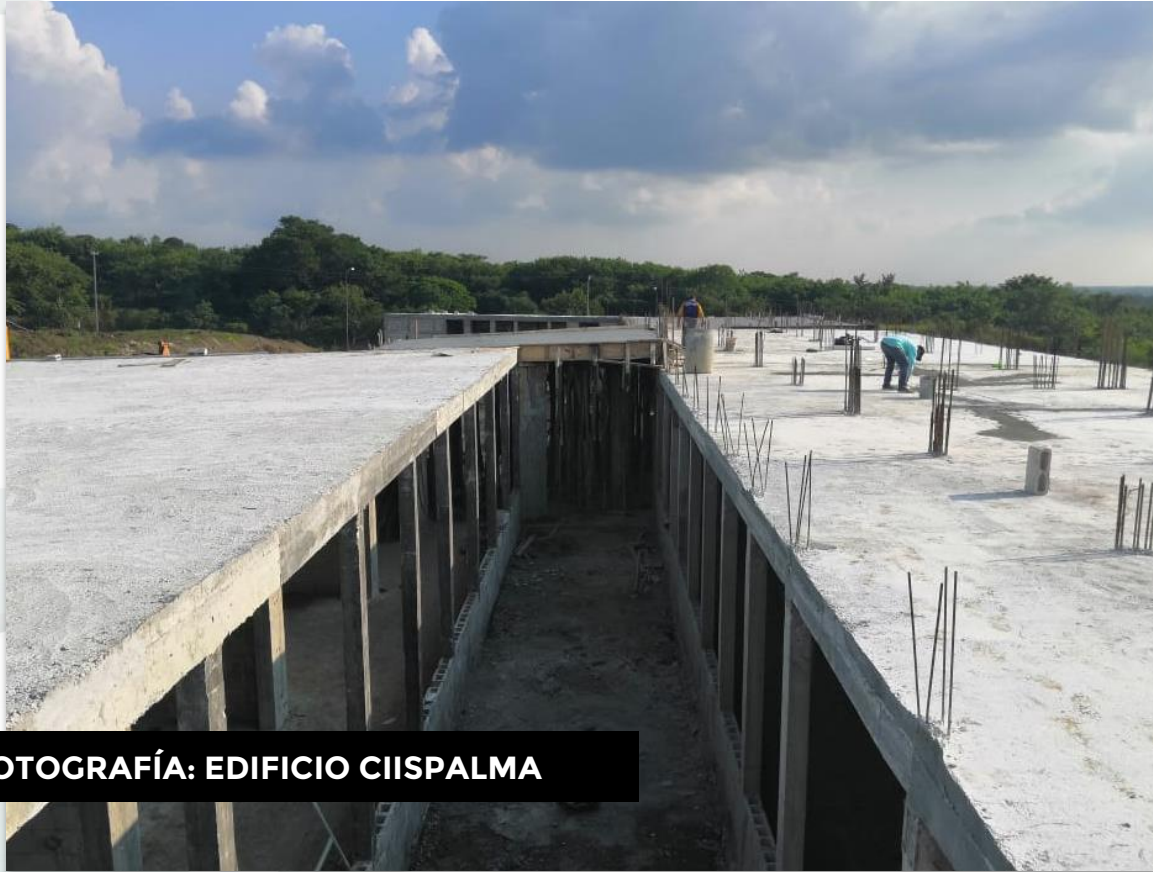
FOTOGRAFÍA: EDIFICIO CIISPALMA