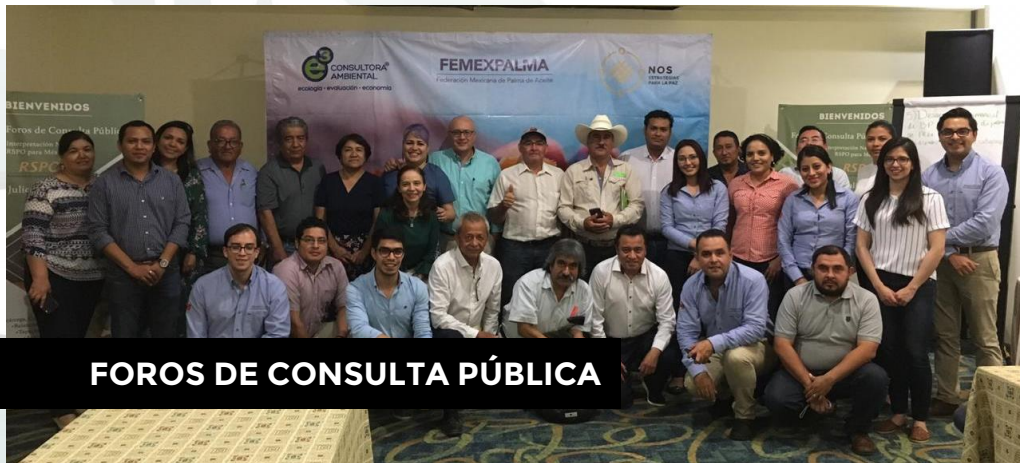
FOROS DE CONSULTA PÚBLICA