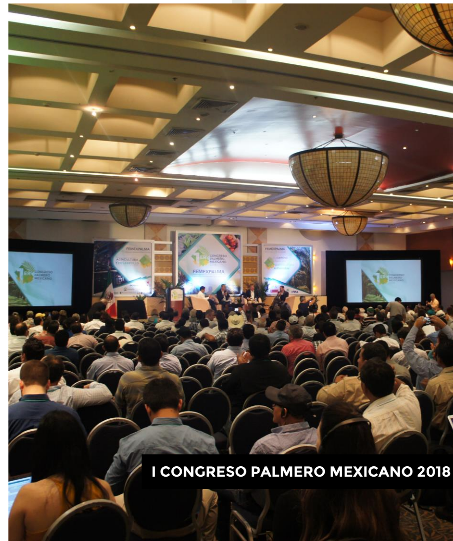
I CONGRESO PALMERO MEXICANO 2018

27 empresas expositoras nacionales e internacionales